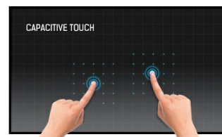
Touch technology - capacitive projetée

Les écrans IPS sont surtout connus pour leurs larges angles de vision et leurs couleurs naturelles très précises. Ils sont particulièrement adaptés aux applications à couleur critique.